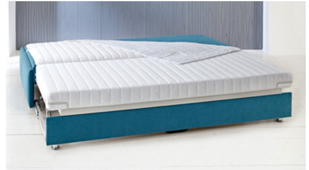
Schlafsofa ohne Bettkasten, Liegefläche 180 x 200 cm