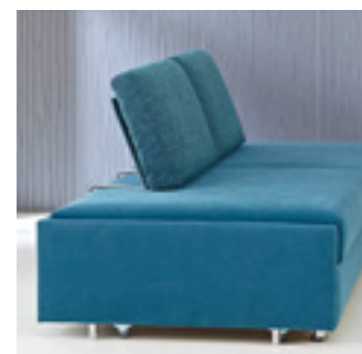
Rückenlehne Typ 9