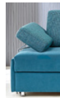
Armlehne Typ 7 (verstellbar)