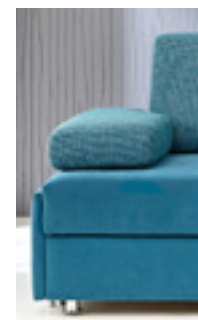
Armlehne Typ 5