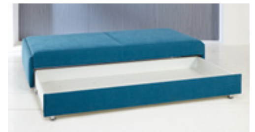
Einzelliege mit Bettkasten, Liegefläche 90 x 200 cm