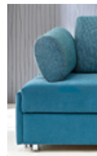
Armlehne Typ 3