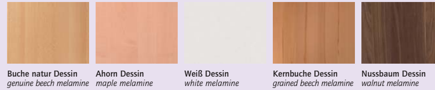
Buche natur Dessin genuine beech melamine