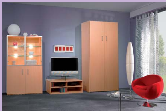
Ahorn Dessin maple melamine

Einlegeböden 19 mm stark wooden shelves behind doors 19 mm thick