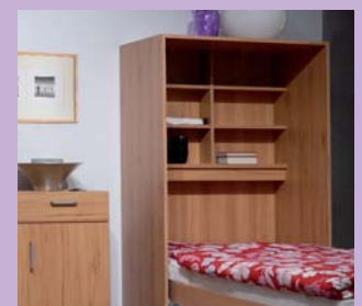
Praktisches Bett-Innenregal: Das Lieblingsbuch sofort griffbereit!

Arrange the Venga moduls according to your own taste: For living and sleeping in one room. Modern and timeless.