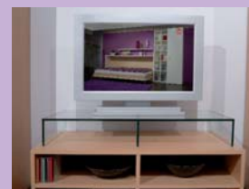
Glas-TV-Bühne glass TV shelf